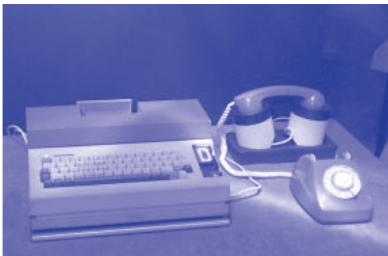
L'ÉQUIPE DU PROFESSEUR JEAN-DANIEL NICLOUD DU LAMI, LABORATOIRE DE L'EPFL, FUT À L'ORIGINE DE CETTE MACHINE DE TRAITEMENT DE TEXTE PORTABLE Scrib pour Bobst Graphic (1980) - MUSÉE Bolo

Certains industriels ont traduit leur passion pour leur métier en collectionnant des matériels de toutes marques. En Allemagne, Nixdorf avait ainsi réuni une remarquable collection de machines de gestion, devenue le noyau du Heinz