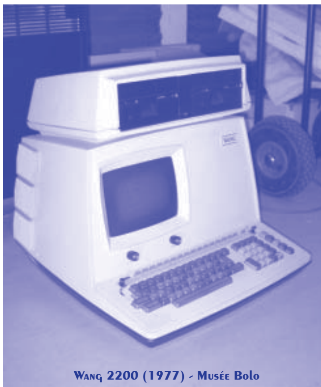
WANG 2200 (1977) - MUSÉE Bolo

Nous nous trouvons maintenant dans une situation où une coordination des collections, des efforts de sauvegarde, des inventaires et des analyses historiques devient nécessaire, au moins à l'échelle européenne et avec les outils que nous offre l'informatique, ... celle d'aujourd'hui. ■