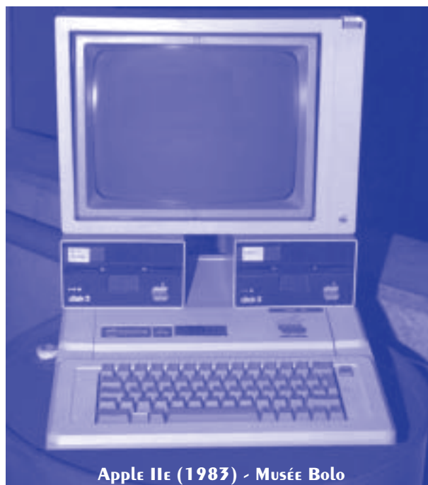
Apple IIe (1983) - Musée Bolo

Combien d'entreprises ont conservé leurs archives, à travers déménagements, restructurations et changements manageriaux ?